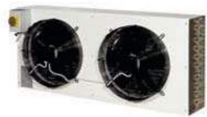
ITMZBT (jednostka zewnętrzna)

Seria osuszaczy niskotemperaturowych ITMBT to wysokowydajne urządzenia zaprojektowane specjalnie dla chłodni niskotemperaturowych, wszędzie tam gdzie poziom wilgotności powinien być kontrolowany podczas przechowywania produktów.