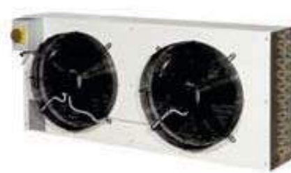
FLZBT (jednostka zewnętrzna)

Seria osuszaczy niskotemperaturowych FLBT to wysokowydajne urządzenia zaprojektowane specjalnie dla chłodni niskotemperaturowych, wszędzie tam gdzie poziom wilgotności powinien być kontrolowany podczas przechowywania produktów.